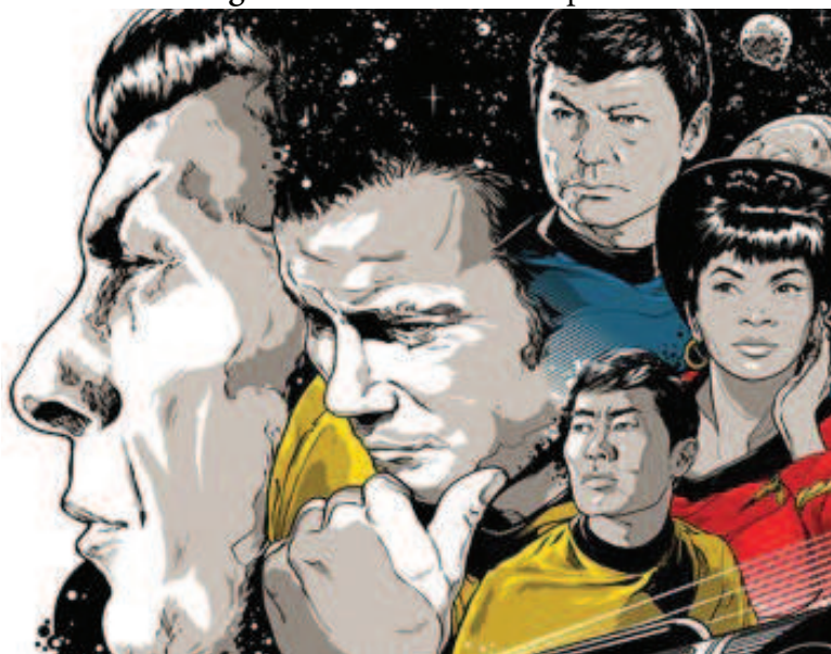
Figura 1: Oficiais da Enterprise .