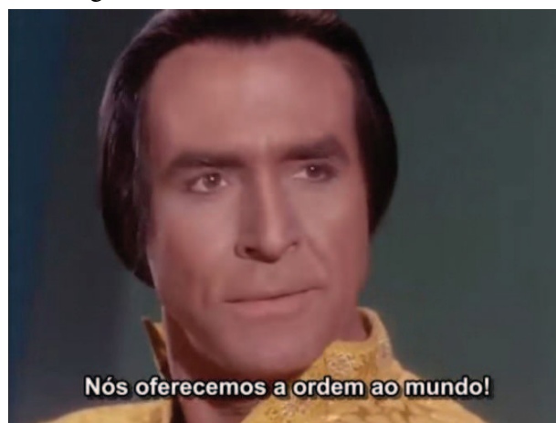
Figura 2: Khan Justifica Sua Ditadura.