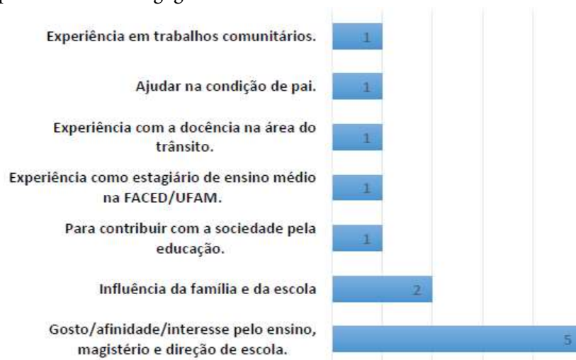
Gráfico 02. Escolha pelo curso de Pedagogia.

Junto a esses aspectos gerais, buscamos, também, conhecer as motivações que levaram os egressos a escolherem cursar Pedagogia. As respostas a esse item foram categorizadas a partir das respostas dadas pelos sujeitos e organizadas no gráfico 02.