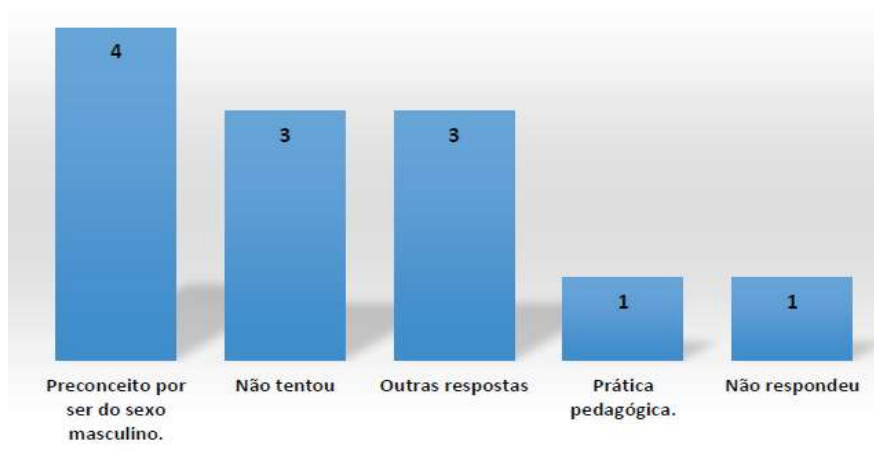
Gráfico 04. Dificuldade de inserção no campo profissional.