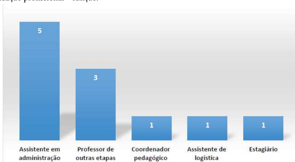
Gráfico 01. Atuação profissional – função.

Também foi inserido um item no questionário para se observar a natureza do trabalho que os mesmos desempenham, visando saber se os mesmos estão atuando ou não na área de formação, mais especificamente na área da docência na Educação Infantil. Nesse sentido, organizamos no gráfico 01 a informação sobre a função que exercem os 11 (onze) egressos que indicaram estar no mercado de trabalho. Para didatizar esse aspecto, organizamos um gráfico: