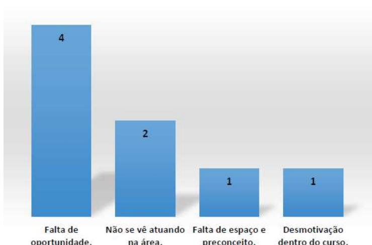
Gráfico 03. Motivos para não atuação na educação infantil.

Os oito (08) egressos que nunca atuaram na docência na Educação Infantil, fora do estágio supervisionado responderam que os motivos se relacionam aos itens dispostos no gráfico 03.