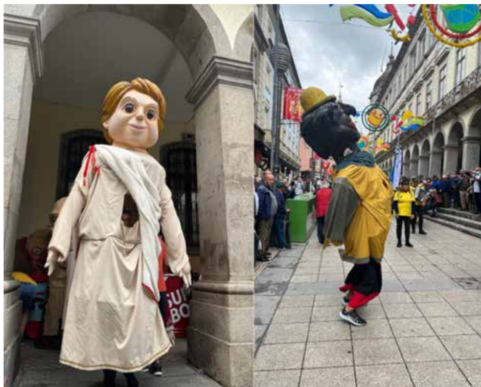
Figura 1. Gigantones na Festa de São João de Braga.