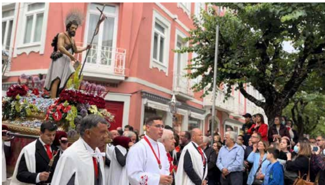
Figura 8. Vista da procissão da festa de São João Batista, Braga, Portugal.