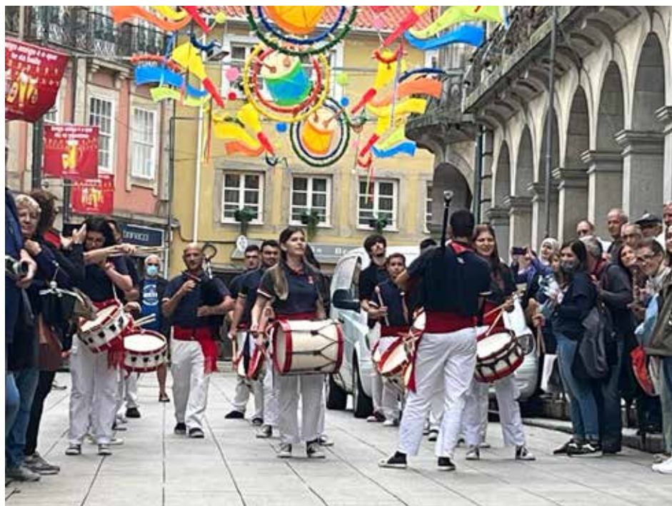
Figura 2. Grupo de Bumbos.