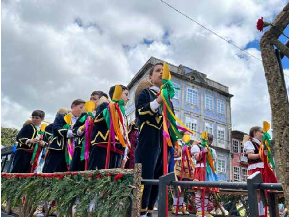
Figura 6. Auto do Carro dos Pastores.