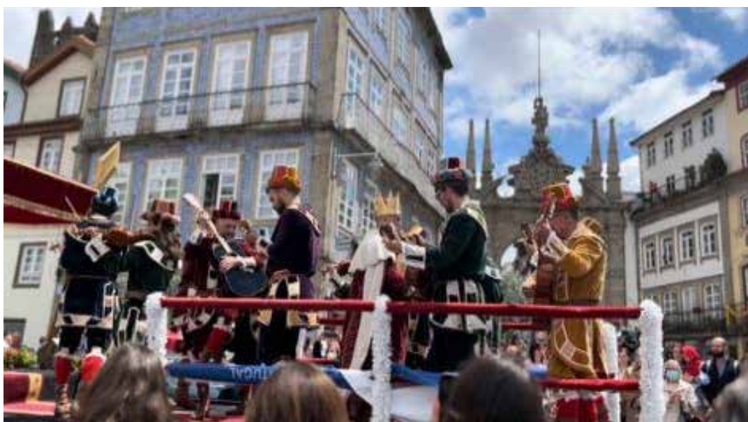
Figura 5. Carro Dança do Rei Davi.