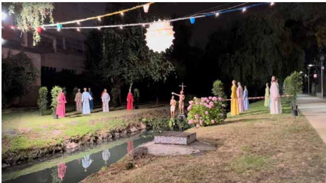
Figura 4. Representação do batismo de Jesus no rio Este.