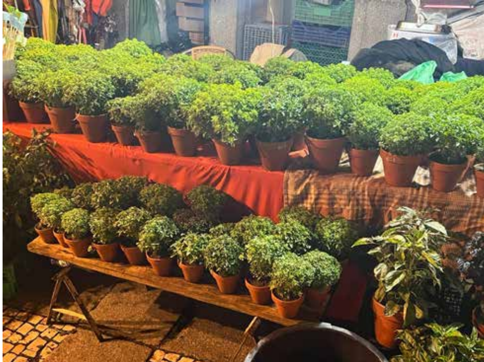
Figura 3. Banca de venda de manjericos.