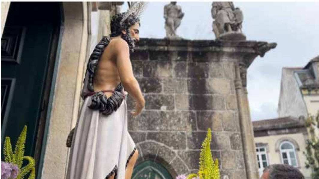
Figura 7. Procissão da festa de São João, Braga, Portugal.