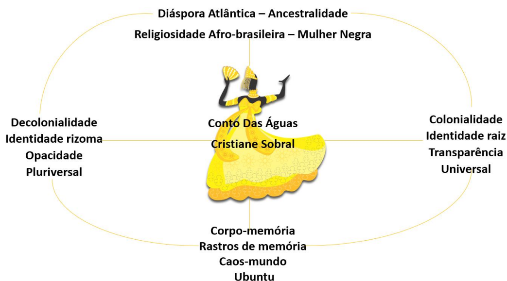
Imagem 1: Categorização dos dados.

Antes do conto “ Das Águas ” ser escolhido como objeto de pesquisa para ser apresentado no evento no VI Congresso Internacional Sociology of Law , trabalhamos com essa narrativa com os alunos da graduação do curso de Letras/Português da Unilasalle, na disciplina de Literaturas Africanas e Afro-brasileira, bem como, com os alunos do mestrado e doutorado em Memória Social e Bens Culturais da Unilasalle, no seminário de Cultura. Nessas aulas, realizamos a leitura, interpretação e discussão a partir de múltiplos olhares dos sujeitos dos professores, alunos, referências teóricas trabalhadas em cada uma das disciplinas. Como as duas disciplinas aconteceram no formato online, com aulas realizadas pelo Google Meet, a leitura, bem como toda a discussão foi gravada, essa experiência de aprendizagem possibilitou a ampliação das possibilidades interpretativas para o processo de unitarização e categorização dos dados. Desse processo surgiram as seguintes categorias representadas na seguinte imagem: