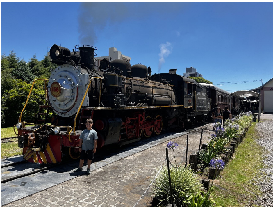
Figura 1. Locomotiva Mikado 156.