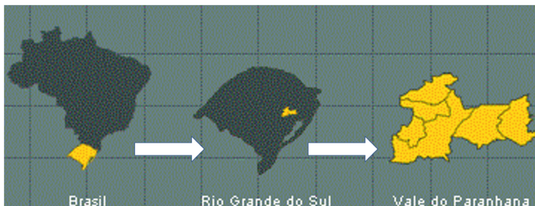
Figura 1. Fluxograma do processo de seleção dos estudos na base de dados BVS, 2023.