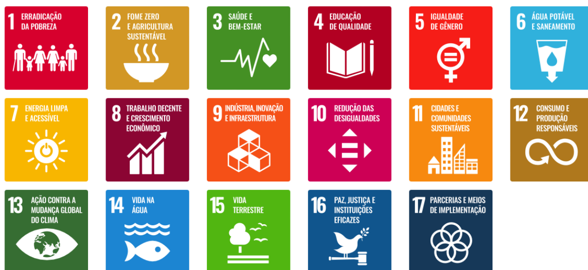
Figura 1. Objetivos de Desenvolvimento Sustentável.