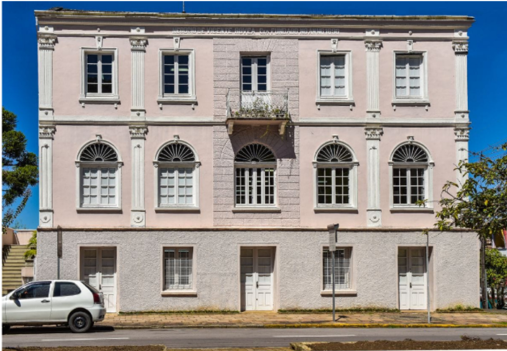
Figura 1. Sede do Arquivo Histórico Municipal João Spadari Adami.