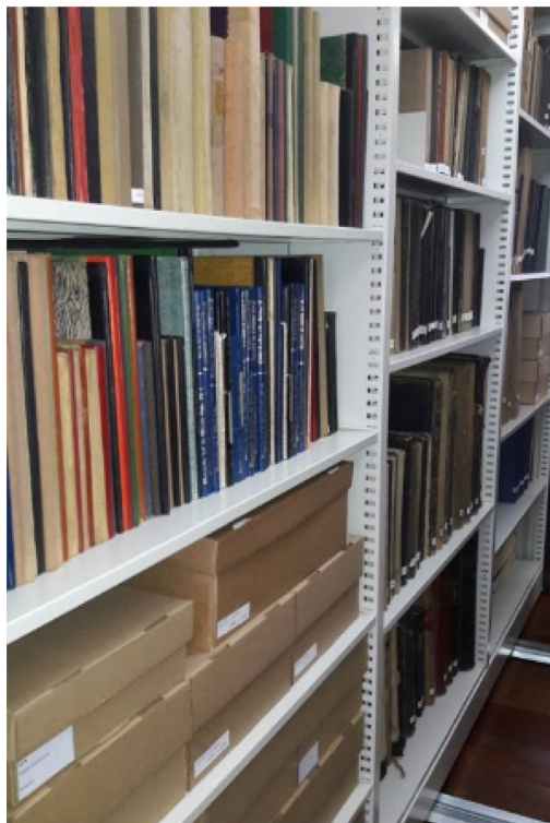
Figura 2. Parte do Acervo do Arquivo Histórico Municipal João Spadari Adami.