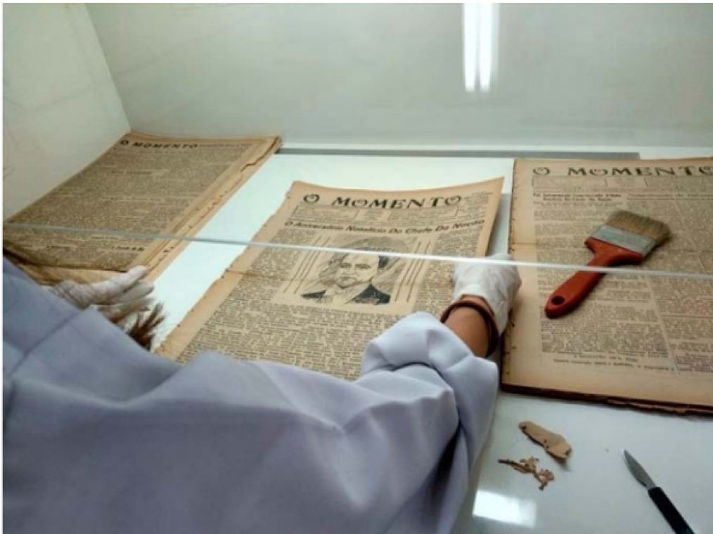
Figura 3. Parte do acervo da Hemeroteca do Arquivo Histórico Municipal João Spadari Adami.