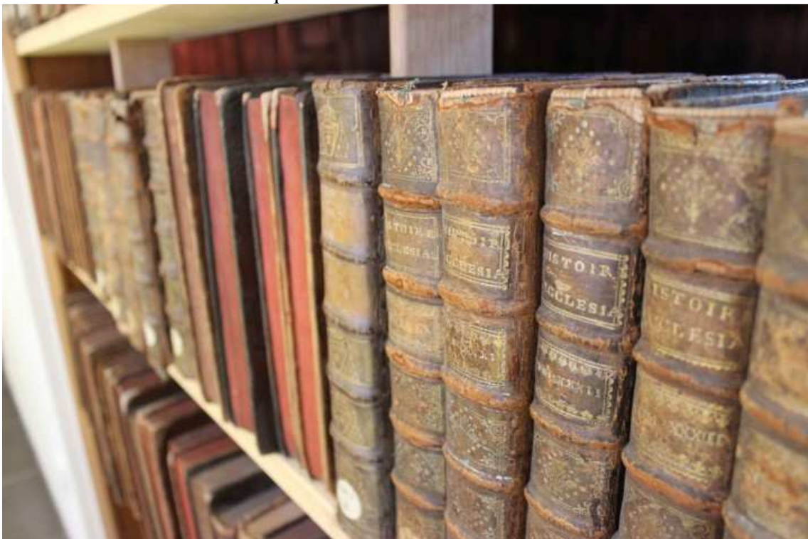
Figura 14 – Biblioteca com coleção de livros pertencentes a João Batista de La Salle que antecedem o século XVII.