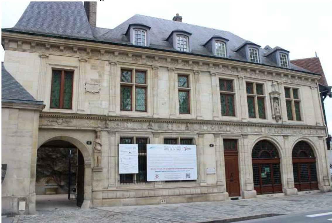
Figura 1 – Fachada do Hôtel de La Salle