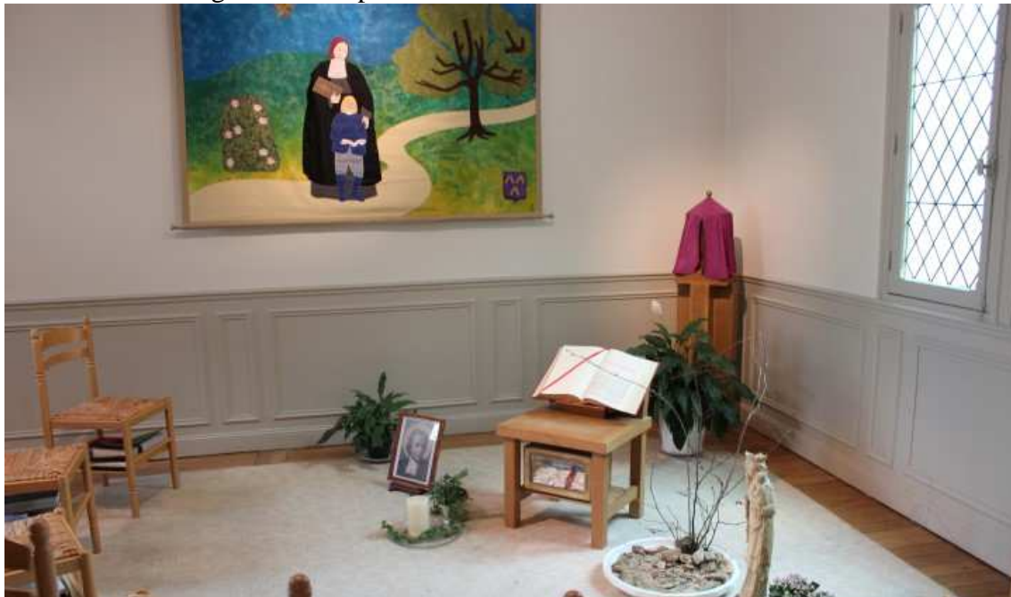
Figura 16 – Capela da residência dos Irmãos Lassalistas.