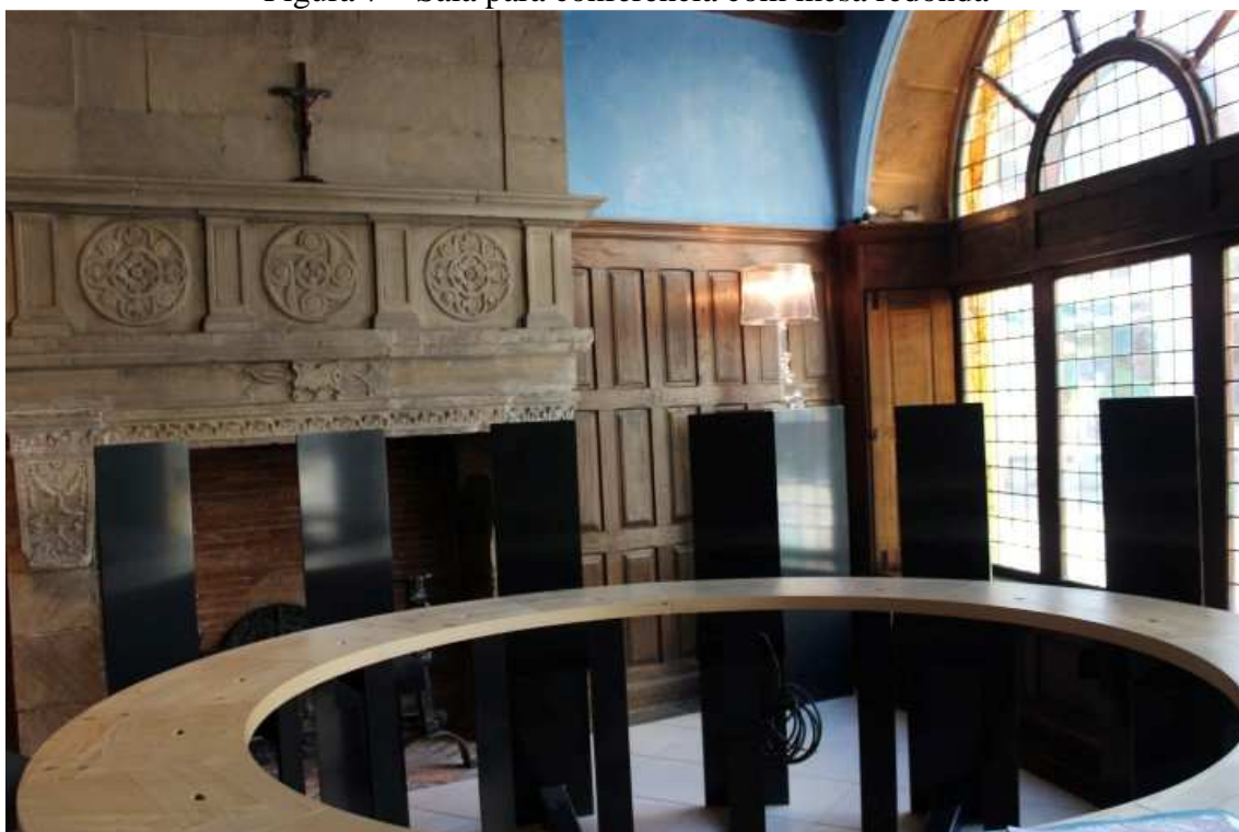
Figura 7 – Sala para conferência com mesa redonda