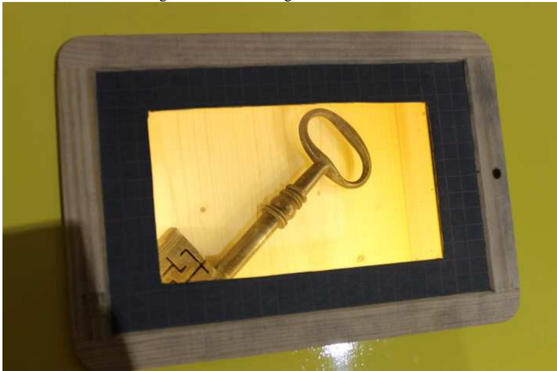
Figura 11 – Chave original do século XVII