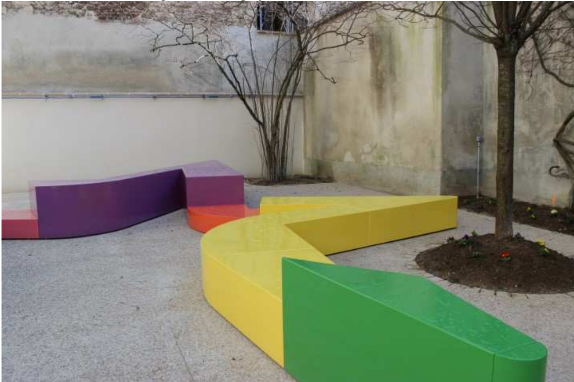
Figura 13 – Espaço externo de convivência.