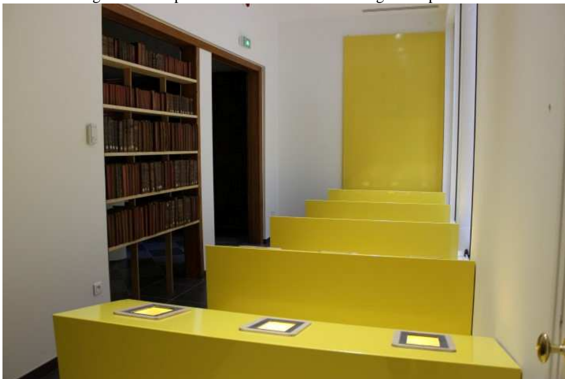
Figura 10 – Réplica da sala de aula vista do ângulo do professor.