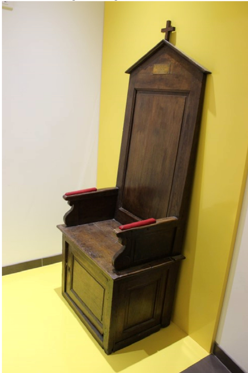
Figura 9 – Cadeira do professor, pertencente a João Batista de La Salle.