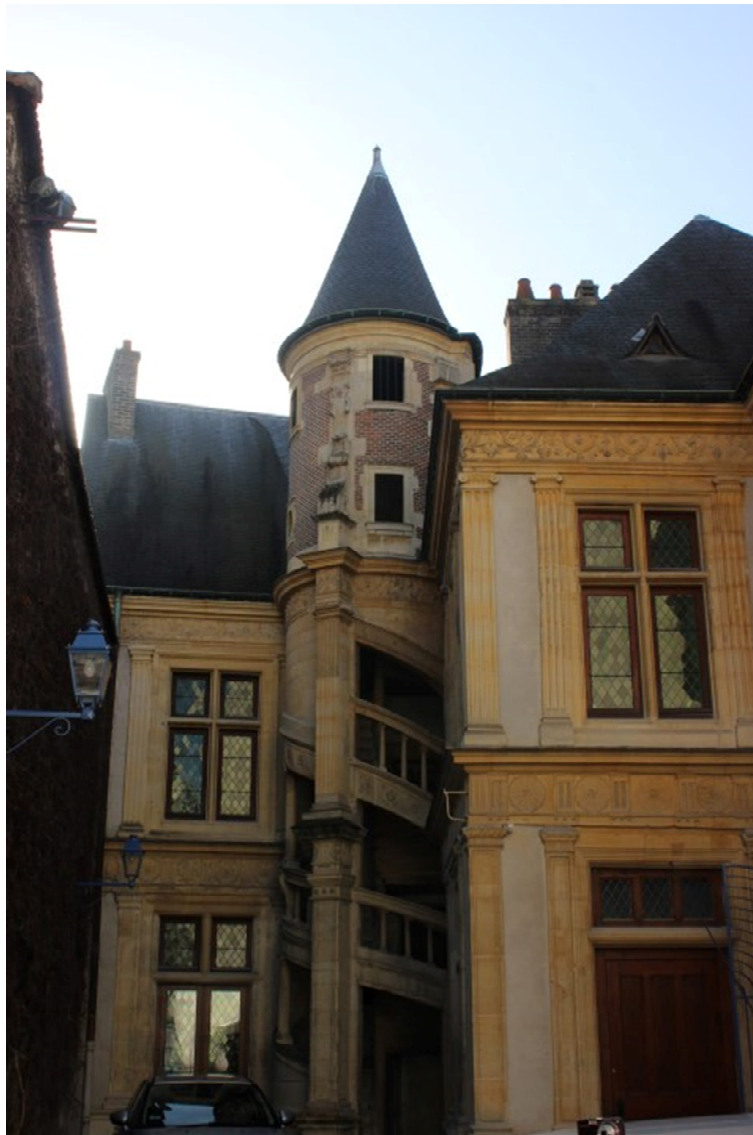
Figura 4 – Detalhe da Torre com escadaria em formato de caracol.