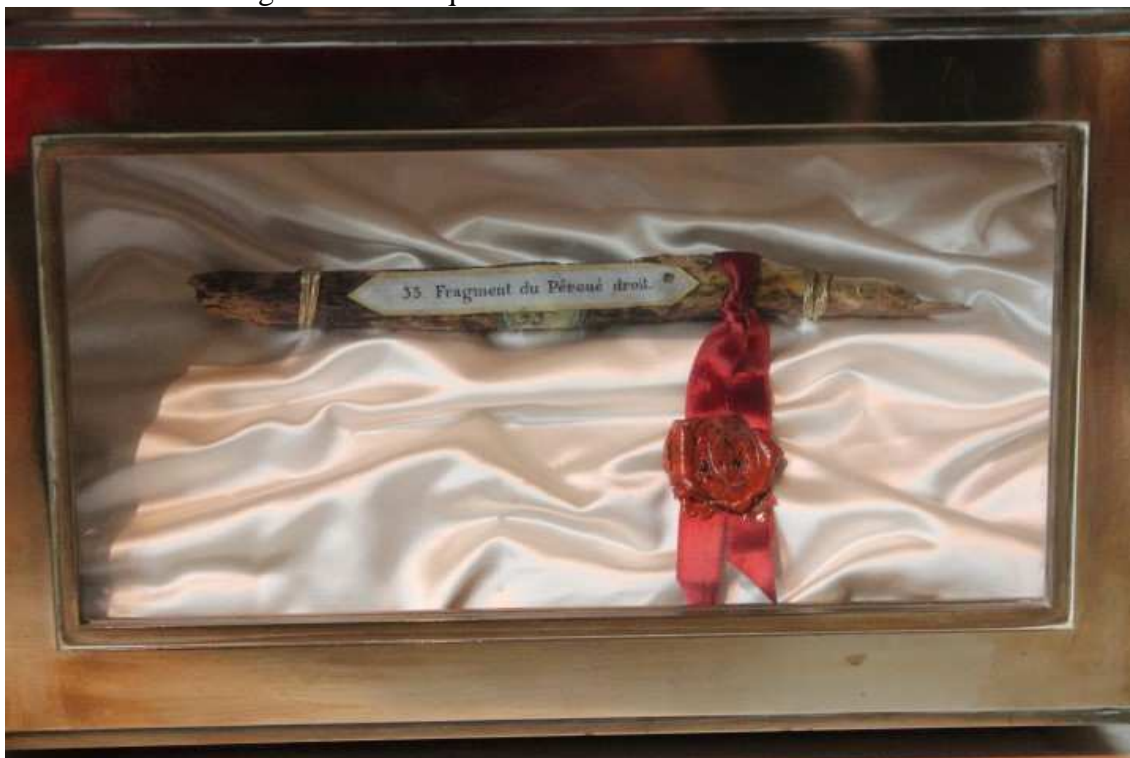
Figura 17 – Relíquia de São João Batista de La Salle.