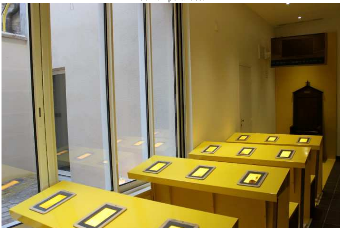
Figura 8 – Uma sala de aula que mistura estética do século XVII e recursos contemporâneos.

Para além de salas de estar, o andar térreo conta com ambientes que procuram ligar passado, presente e futuro. A sequência de figuras apresentadas a seguir mostra a recriação do modelo de sala onde São João Batista de La Salle lecionava e formava professores por meio da mistura de objetos do século XVII e recursos contemporâneos, como tablets embutidos.