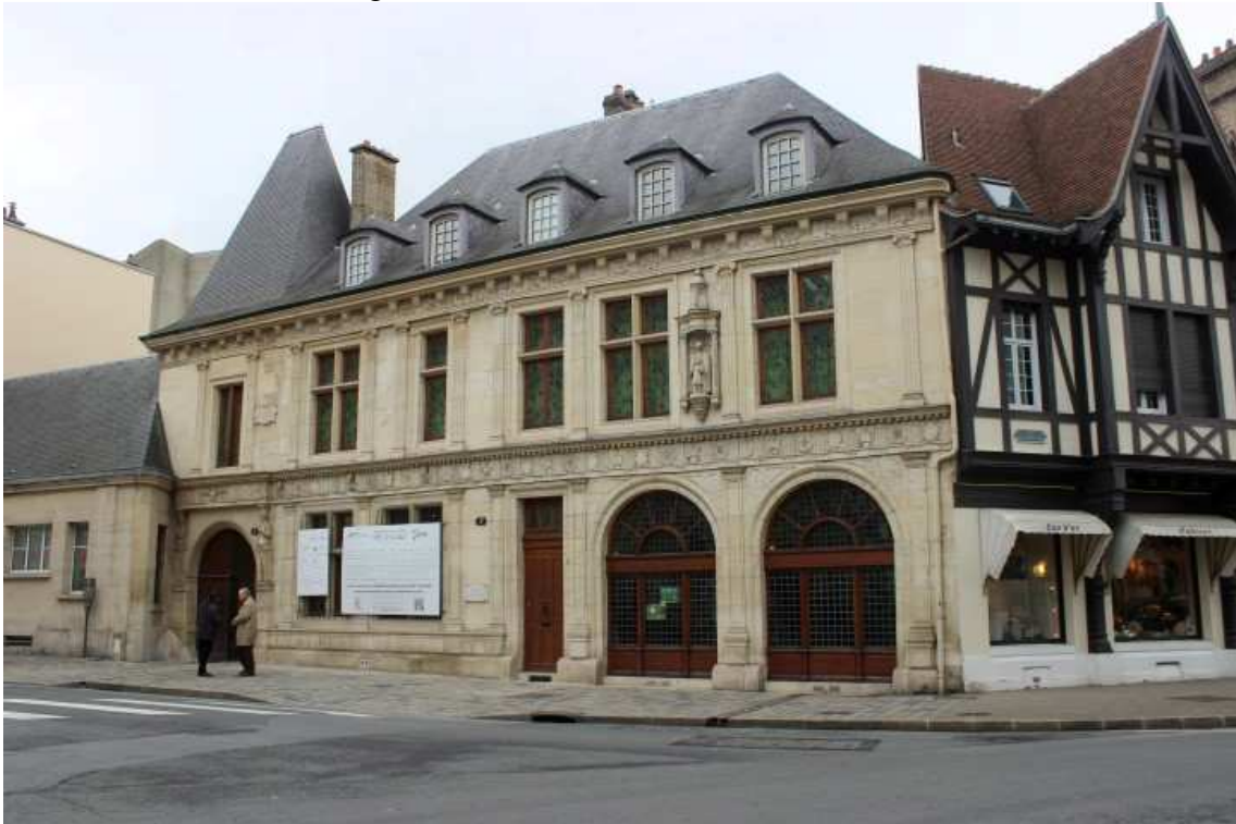
Figura 3 – Fachada do Hôtel de La Salle