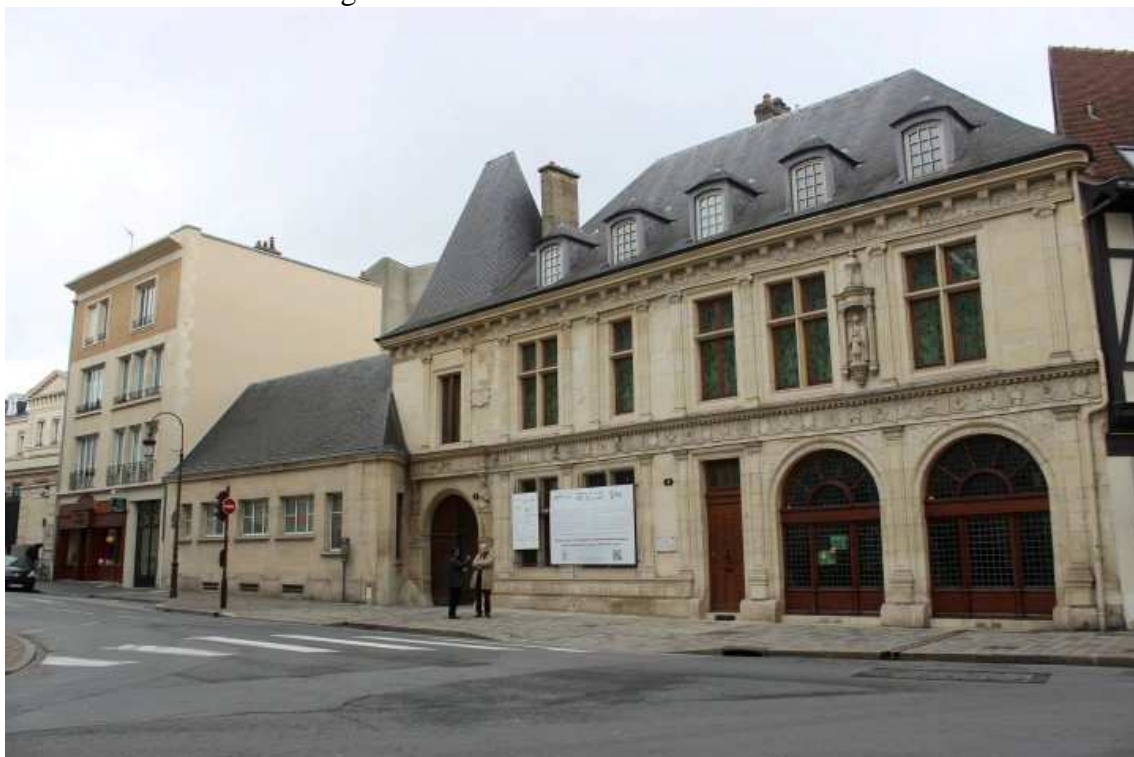
Figura 2 – Fachada do Hôtel de La Salle