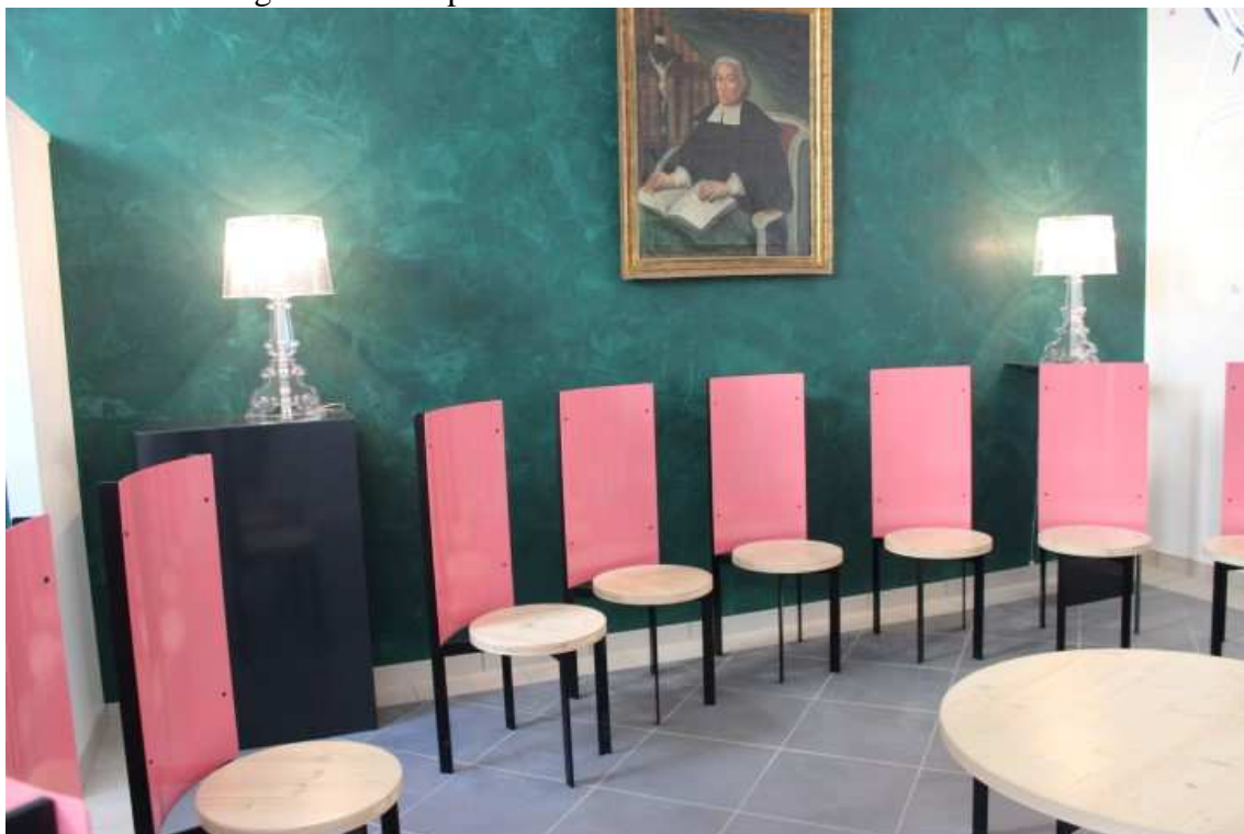
Figura 6 – Sala para conferência com cadeiras em círculo