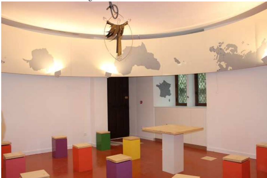
Figura 12 – Sala Países do Mundo.

A Figura 12 retrata a Sala Países do Mundo. É digno de nota que os bancos que aparecem na imagem são giratórios, possibilitando a uma pessoa dialogar com outra pessoa em todos os ângulos. As imagens seguintes trazem outros ambientes de convivência inspiradas no carisma lassalista, além de relíquias que marcam a presença do Santo fundador.