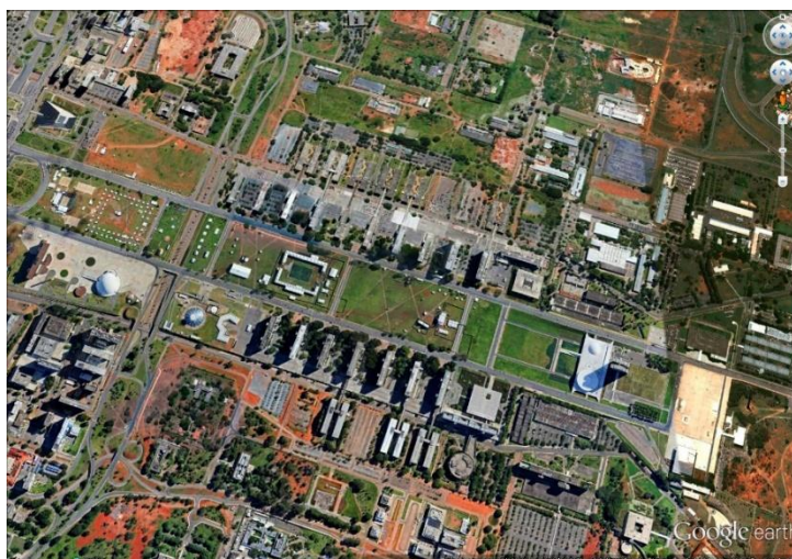
Figura 5: Cidade de Brasília, DF, Brasil.

A figura 5 aproxima a tomada para o eixo dos ministérios. Um ponto importante dentro da lógica desta cidade e para onde será feito uma aproximação.