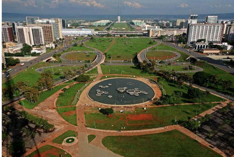
Figura 6: Cidade de Brasília, DF, Brasil.

A figura 6 apresenta o eixo dos ministérios vistos de cima da antena da rádio com o Palácio do Planalto ao fundo.