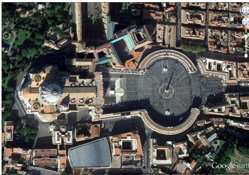
Figura 1: Praça São Pedro, Vaticano.