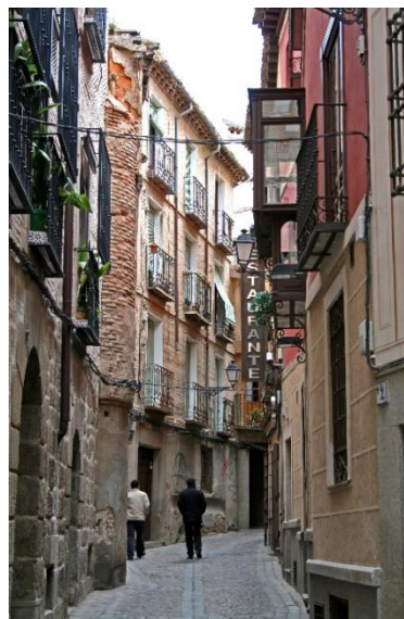
Figura 3: Cidade de Toledo, Espanha.