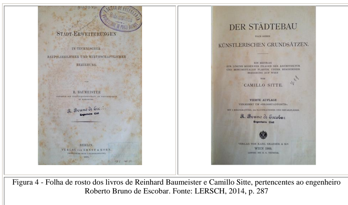
Figura 4 - Folha de rosto dos livros de Reinhard Baumeister e Camillo Sitte, pertencentes ao engenheiro Roberto Bruno de Escobar.

Estudando o contexto em Berlim (LERSCH, 2014, p. 78), sabe-se agora que estes fascículos eram vendidos no meio universitário, e que, portanto, o jovem engenheiro utilizou-se desta oportunidade para adquiri-los. Além destes, foram localizadas no acervo de livros raros da Escola de Engenharia a obra de Reinhard Baumeister, Stadt-erweiterungen in technischer, baupolizeilicher und wirtschaftlicher Beziehung (A expansão das cidades e sua relação com os aspectos técnicos, edílios e econômicos), publicado em 1876, que se tornou o primeiro tratado urbanístico germânico de grande difusão, e a obra de Camillo Sitte Der Städtebau nach seinen künstlerischen Grundsätzen (A Construção das Cidades segundo seus Princípios Artísticos), em sua quarta edição, publicada em 1909, que também pertenceram a Escobar (Figura 4).