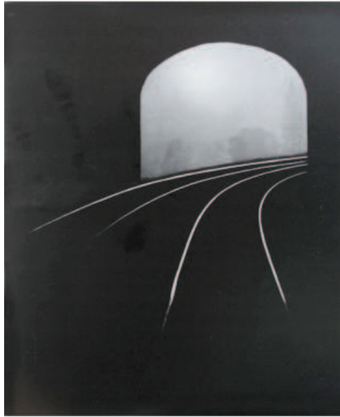
Figura 3 - O túnel. 1951.