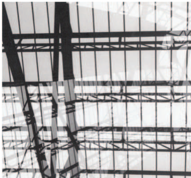
Figura 4 - Geraldo de Barros. Fotoforma (Estação da Luz), 1949

Fonte: BARROS, Geraldo. Fotoformas. São Paulo: Cosac Naify, 2006.