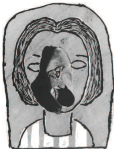
Figura 2 - A menina do sapato, 1949.

Fonte: BARROS, Geraldo. Fotoformas. São Paulo: Cosac Naify, 2006.