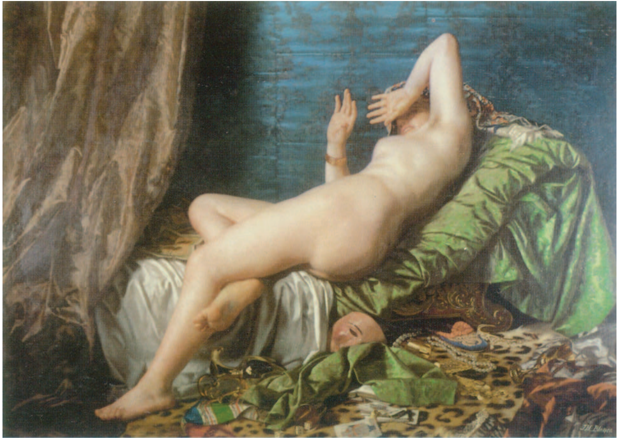
Figura 4 - Juan Manuel Blanes: Demonio mundo y carne