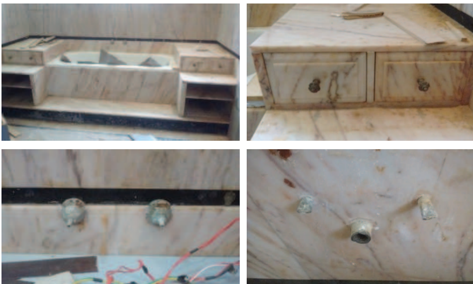
Figura 9: Detalhes da banheira sem a cobertura.