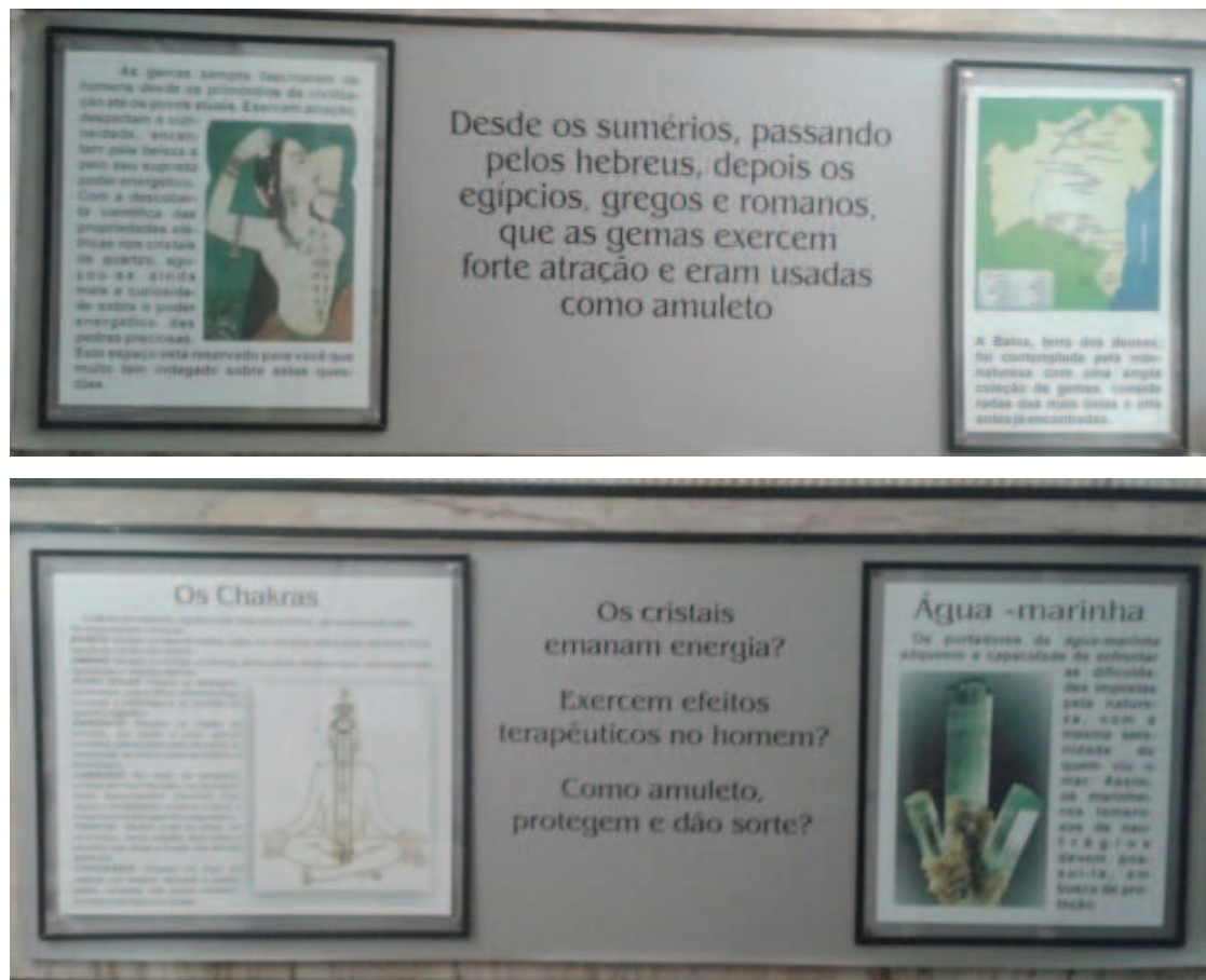
Figura 7: Painéis com textos introdutório e setoriais.

Além dos textos informativos, a sala dispunha de dois painéis laterais, fixos na parede, cada um com 225 cm x 80 cm (figura 7), contendo textos introdutório e setoriais, assim distribuídos: texto de apresentação da sala, questionamentos sobre a emanção de energia pelos cristais, posicionamento dos chacras no corpo humano, mapa da Bahia com a localização das minas produtoras de gemas coradas e a imagem do cristal representativo do mês (12 impressões trocadas mensalmente).