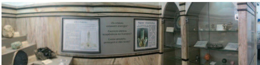
Figura 3: Painel e armários embutidos.