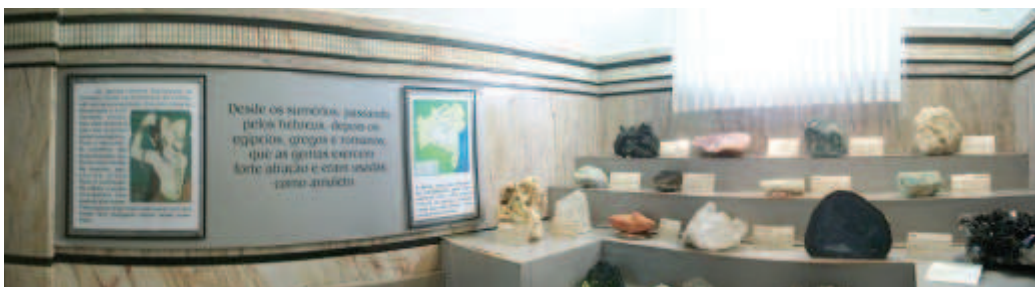
Figura 2: Painel lateral e expositor em degraus.