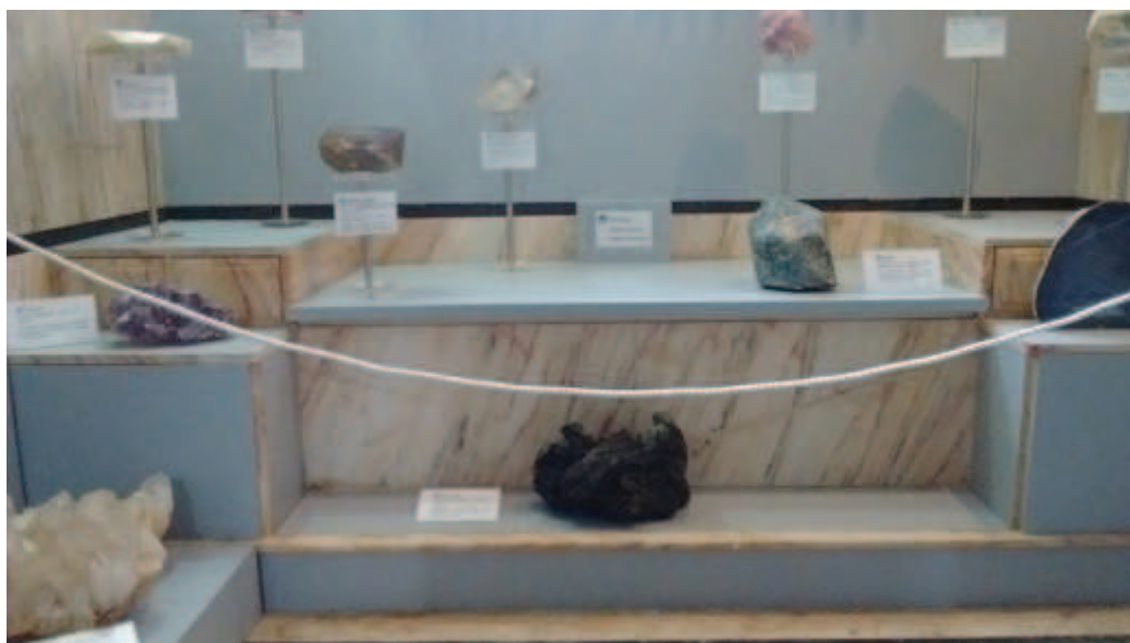
Figura 10: Novo formato após o revestimento da banheira.

Ao compararmos o revestimento novo, dos armários e do expositor de madeira, com o antigo dos painéis, observa-se uma pequena alteração de cor: cinza médio (painéis) e cinza claro, azulado, do revestimento novo (Figura 11).