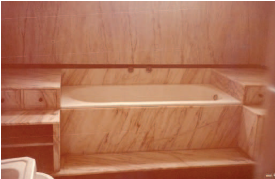
Figura 8: Antiga banheira.