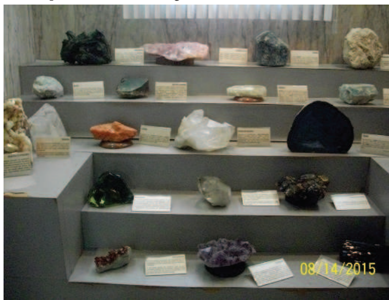
Figura 5: Cristais brutos no expositor em forma de grau.