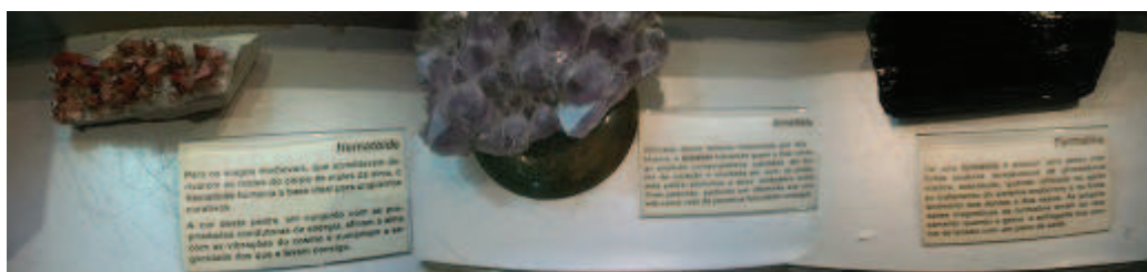
Figura 6: Textos informativos longos ao lado de cada peça.