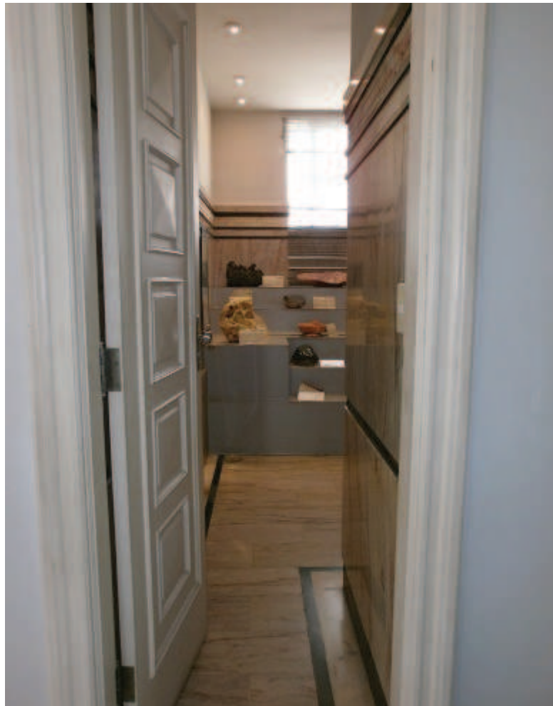
Figura 1: Entrada da exposição.