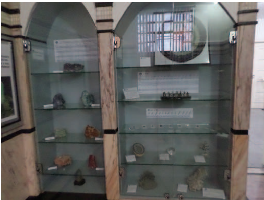
Figura 12: Vitrines da Exposição.

Faz-se necessário ressaltar, como vimos anteriormente, que os painéis não passaram por reforma física ou reformulação textual, mas, por outro lado, passaram a estar vinculados aos novos núcleos expositivos: o de abertura da exposição e o mapa da Bahia, associados ao “Cristais, origem do nome e aspectos históricos”; a imagem dos principais chacras do corpo humano, ao “Cristais e Chacras uso terapêutico” e a imagem do cristal representativo do mês, ao módulo “Uso artesanal e esotérico”, que dispõe de doze imagens, substituídas mensalmente.