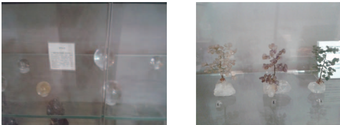
Figura 4: Quantidade excessiva de bolas de cristal e árvores da felicidade (vitrina).

Três questões eram fundamentais para a equipe de requalificação da exposição: o aumento da área destinada a circulação, que naquele contexto, restringia-se a pouco mais de 4,5 m 2 ; reduzir o número de objetos da exposição, que perfazia um total de 99 peças entre minerais brutos e lapidados (Figuras 4 e 5); e sintetizar os longos textos informativos que acompanhavam os exemplares (Figuras 6).