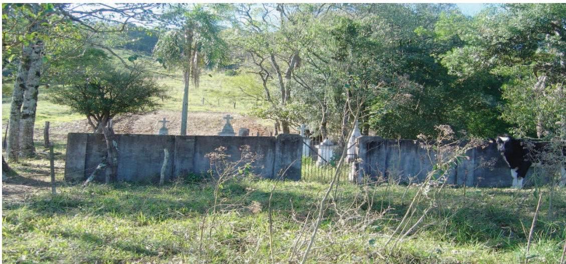
Figura 3 - Cemitério florestal ( Urwaldsfriedhof ) de Picada Essig (2013). Mesmo situado em meio a um potreiro em propriedade particular, o Urwaldsfriedhof é um importante espaço de memória comunitária. É também um símbolo das privações e sacrifícios dos colonos diante do Urwald .