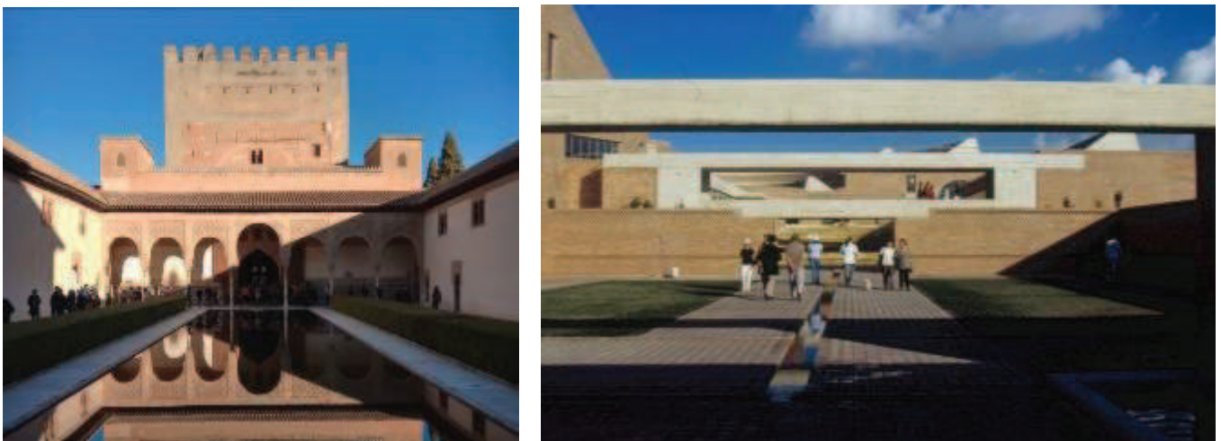
Ilustración 7. Izquierda: Fachada norte del Patio de Arrayanes en la Alhambra. Derecha: Acceso de la Biblioteca Virgilio Barco.

Fuente: Izquierda - Fotografía de Manuel Saga, 2015. Derecha Fotografía original de Rogelio Salmona. Fuente: Fundación Rogelio Salmona.