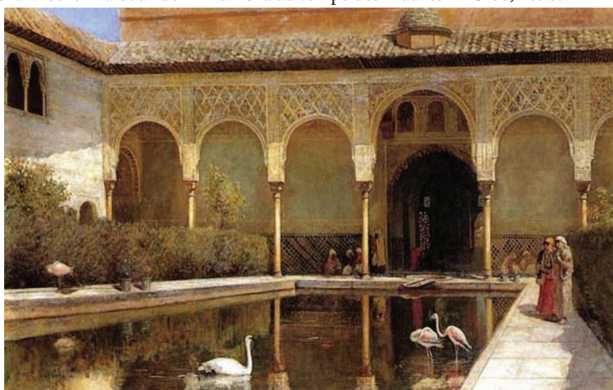
Figura 5. Edwin Lord Weeks “La cour de l’Alhambra au temps des maures” – Óleo, 1876.