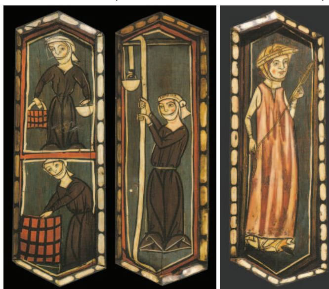
Figura 8. Detalle de la techumbre mudéjar de la Catedral de Teruel, con mujeres trabajando en la construcción.