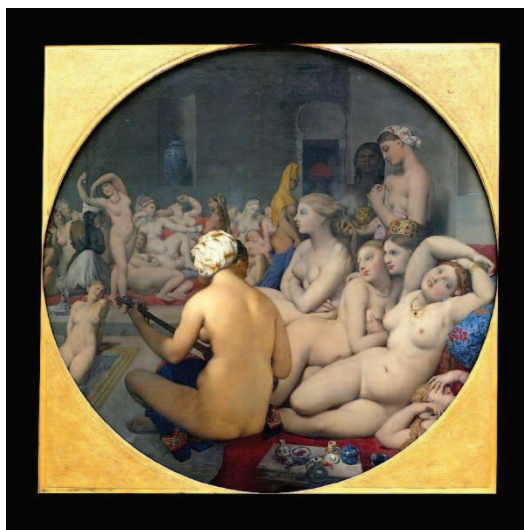
Figura 2. Le Bain turc © 2007

Aún entre tanta fantasía, tras las celosías existían mujeres sujeto valiosas y respetadas tal y como muestran los tratamientos oficiales y los epítetos que las acompañaban: la noble, la señora, la libre, la casta, la pura, la piadosa, la virtuosa, la decente, la ilustre, la excelsa, la elevada, la honrada, la respetada, la bienhechora, la limosnera, la caritativa, la célebre, la solemne, la grandiosa, la perfecta e incluso la dichosa (BOLOIX, 2013).