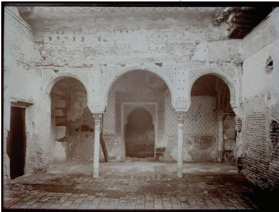
Figura 7. Torres Molina, Manuel “Patio del Harem” Primer tercio del siglo XX.