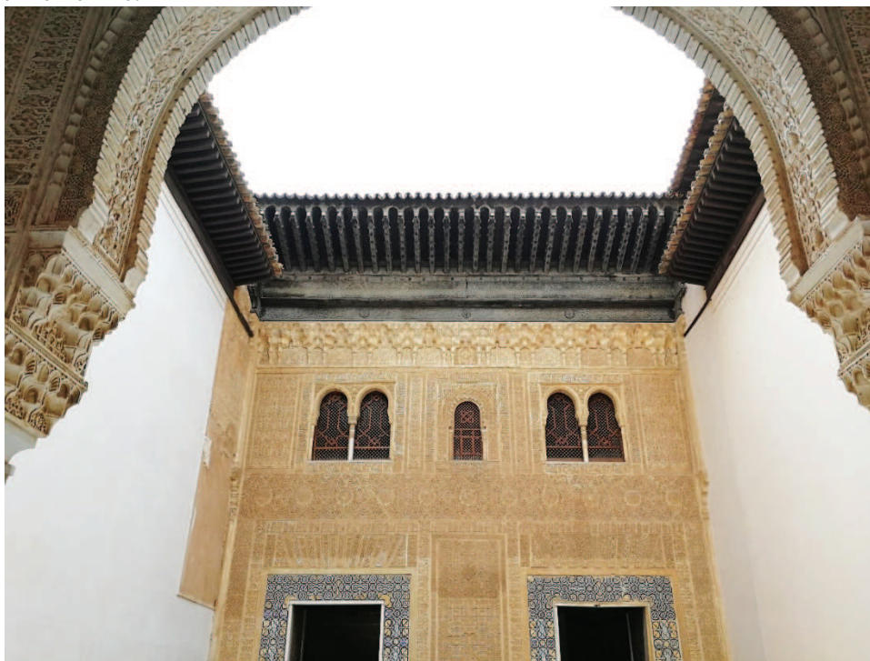
Figura 3. Fachada de Comares: la entrada a los palacios se observa a través de las celosías como el primer vestigio de la Alhambra en femenino.

Aún en la actualidad, en la arquitectura islámica las estancias femeninas se abren a los espacios interiores y a los patios que dan paso a las diferentes estancias independientes. Así se recoge en las fuentes árabes que comparan el placer con la arquitectura y a ésta con la mujer honrada, es decir, la desposada o la virgen, recelosa del exterior y que se explaya hacia el interior (RUBIERA, 1988).