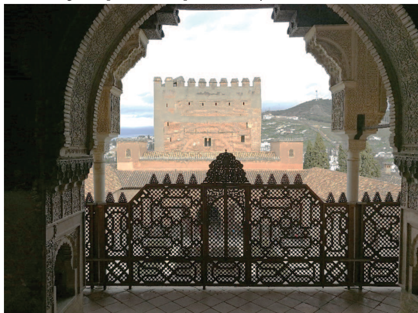
Figura 1. Desde la Galería del segundo piso, sobre el patio de Arrayanes, con la celosía de madera filtrando la belleza