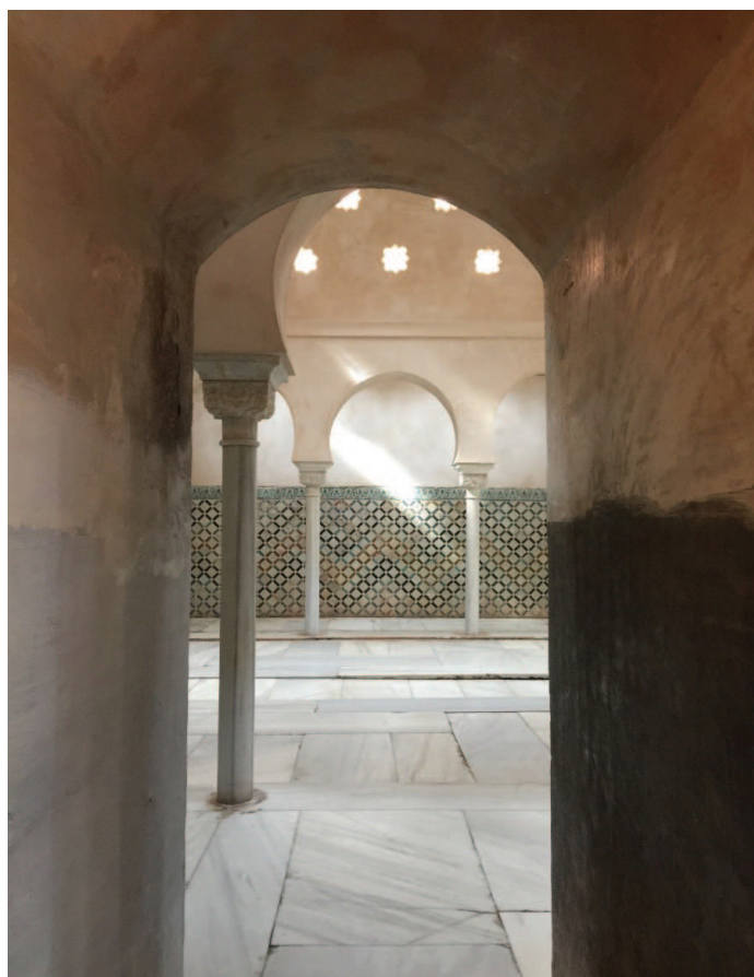
Figura 6. La luz se filtra tenuemente por las linternas y crea el ambiente propicio para el goce y el descanso.