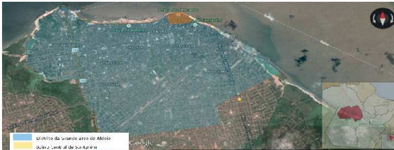
Figura 1 – Mapa do bairro Central dentro da Zona Distrital e também referência da localização da cidade dentro do Estado do Pará.

Arte: Elaborado pela Autora. 2012.