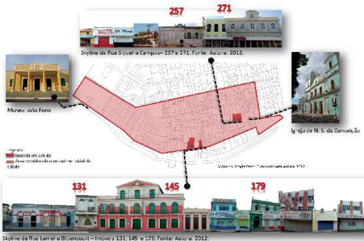
Figura SEQ Figura \* ARABIC 16 – Mapa da cidade de Santarém – área central da cidade e a localização dos imóveis em estudo.

Fonte: Acervos Estefany Couto, Rafael Serique e Ramon Santos. 2012. Elaboração: Autora. 2013.