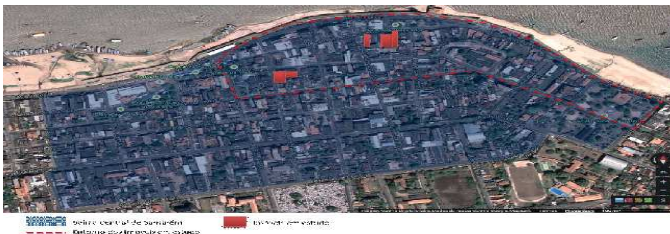
Figura SEQ Figura \* ARABIC 2 – Mapa do bairro Central dentro da Zona Distrital e também referência da localização da cidade dentro do Estado do Pará.

Arte: Elaborado pela Autora. 2012.