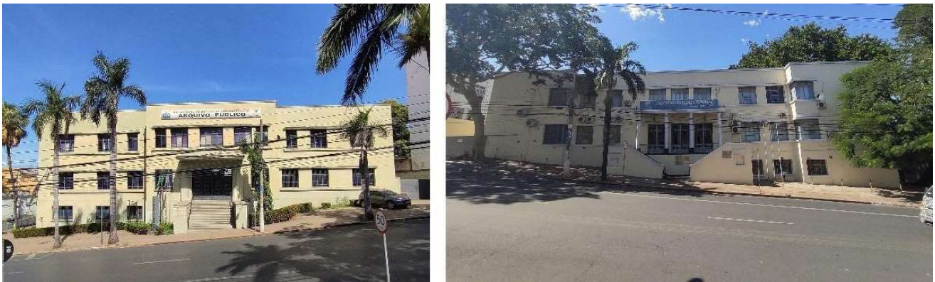
Figura 4. Fachadas principais da antiga Secretaria Geral (à esquerda) e Palácio da Justiça (à direita).