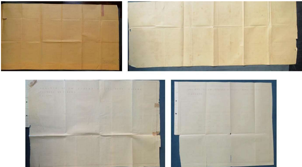
Figura 13. Desenhos dos projetos da Ponte Júlio Müller (na parte superior) e do Cine Teatro e Grande Hotel com algumas informações apagadas (na parte inferior).