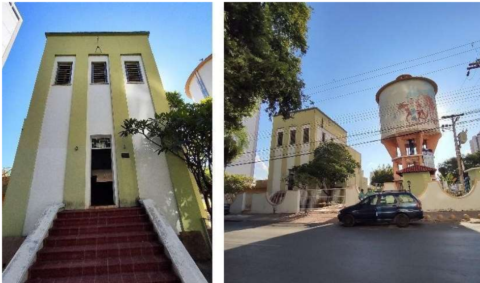
Figura 6. Fachada do edifício da Estação de Tratamento de Água Presidente Marques. À direita o edifício e ao lado o reservatório de água.

O pequeno edifício da primeira estação de tratamento de água de Cuiabá, E.T.A, Presidente Marques (1939) se mostra como um volume prismático único de dois pavimentos onde a fachada é livre de ornamentações, mas possui elementos como linhas retas em relevo que conformam um desenho, reforçam a verticalidade e trazem certa simetria à fachada do edifício. A entrada principal é marcada pela simetria e pela escadaria que dá acesso ao interior do prédio. A composição da escada, corpo do edifício e inter rompimento da continuidade das linhas em relevo da fachada na parte superior, reforçam a conformação de base, corpo e coroamento recorrente nos edifícios do estilo Art Déco (fig.6).