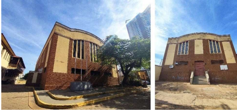
Figura 3. Composição das fachadas do Ginásio do Colégio. À esquerda a fachada principal voltada para a via e à direita a fachada dos fundos.