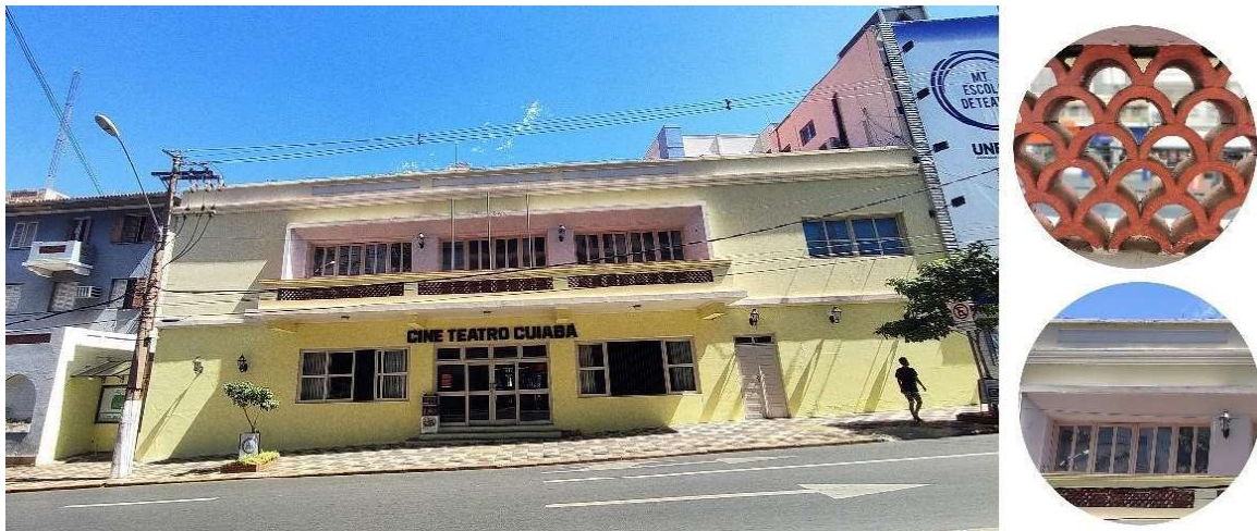
Figura 8. Detalhes da fachada principal do Cine Teatro.

Por fim, dentre os edifícios institucionais identificados por suas referências ao Art Déco, dispomos o Cine Teatro (1942). O edifício possui dois pavimentos composto por um único prisma, a entrada principal é marcada pela simetria e marquise gerada pela pequena varanda do pavimento superior (fig. 8). A fachada é sóbria com alguns detalhes como: jogo de relevo entre elementos retangulares na platibanda que coroa o edifício, alguns frisos horizontais e uso de elementos cerâmicos vazados, cobogós, no guarda corpo da sacada.