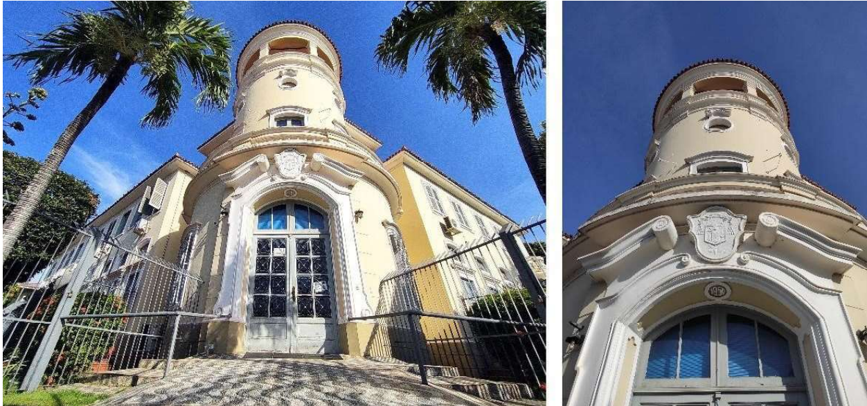
Figura 11. Fachada principal de entrada do Palácio Episcopal.

— sendo o quarto pavimento, uma espécie de coreto — e dois prismas de dois pavimentos dispostos lateralmente à torre, simetricamente em um ângulo de noventa graus (fig. 11). Apresenta características de referências coloniais e barrocas. A entrada principal é marcada pela simetria da fachada e por elementos voluptuosos na parte superior da entrada que também é voltada para a esquina conformada pelas vias Avenida Dom Aquino e Rua Clóvis Huguenei, na região central de Cuiabá.