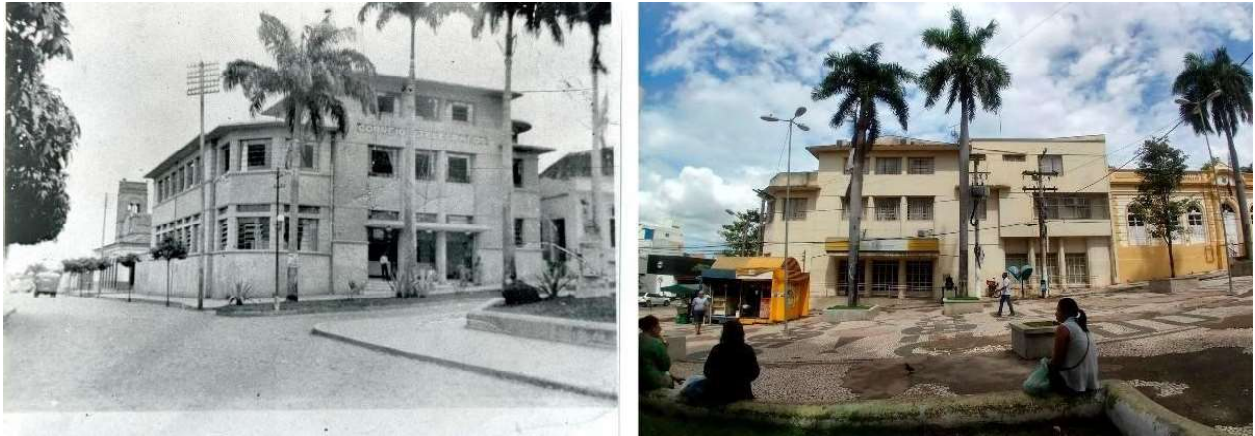
Figura 7. Departamento de Correios e Telégrafos de Cuiabá, à esquerda foto sem data definida e à direita foto do edifício atualmente.