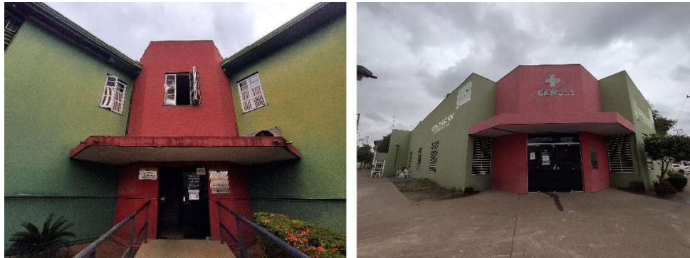
Figura 1. Acessos principais do edifício da Central de Regulação do SUS (antigo Centro de Saúde) em Cuiabá.