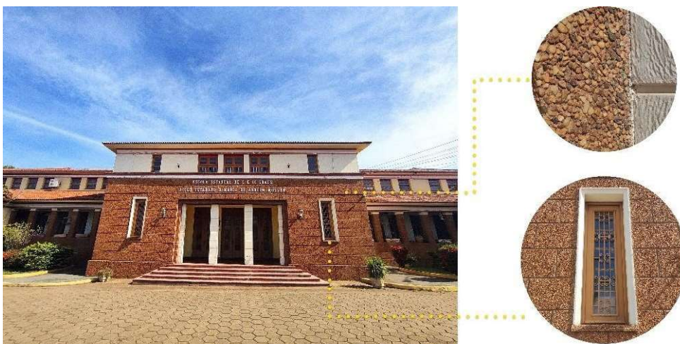
Figura 2. Fachada principal do Colégio Liceu Cuiabano, antigo Colégio Estadual e detalhe do revestimento e das janelas da entrada principal.

O colégio estadual (1944) apresenta prismas mais robustos e sólidos que transparecem a impressão de imponência e seriedade. A fachada principal, que dá acesso ao auditório do colégio, é escalonada e marcada pela composição de um prisma de um pavimento revestido com uma espécie de pedras pequenas misturada com argamassa (fig. 2) e outro volume prismático recuado de dois pavimentos, com planta em formato de “M” — o corpo principal do edifício — porém com revestimento diferente. A fachada é livre de ornamentos (salvo algumas marcações em relevo) e composta por janelas e colunas ritmadas, algumas extremamente estreitas e verticalizadas. Ao lado do edifício temos o ginásio que apresenta em sua fachada alguns motivos geométricos, um jogo entre cores, texturas e linhas discretamente destacadas que a compõe em uma abstração de formas retas e curvas (fig. 3).