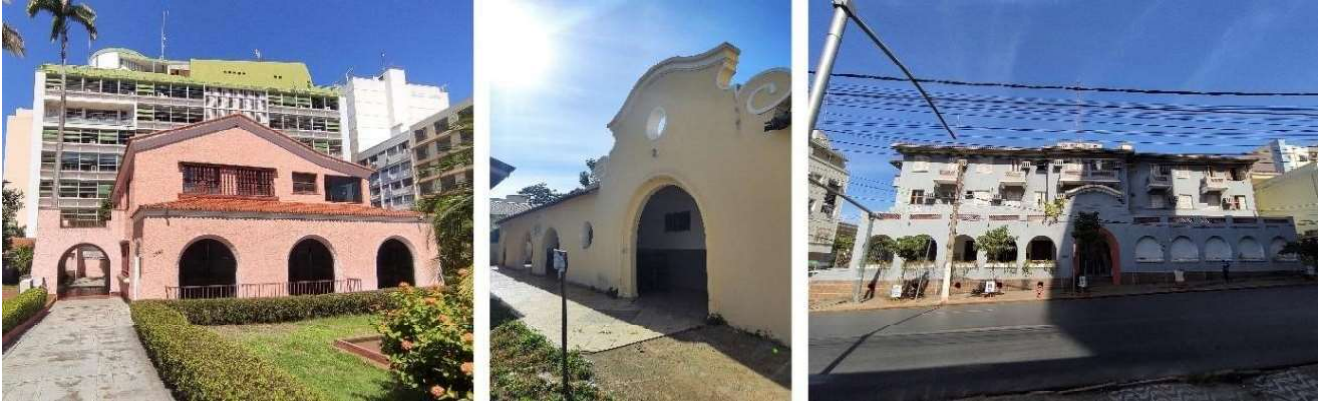
Figura 9. Fachadas da Residência dos Governadores (à esquerda), Abrigo Bom Jesus e Grande Hotel (à direita).

no “estilo missões”. Além disso, o Abrigo e o Hotel possuem a entrada marcada por um pórtico com frontão curvo, as vezes com volutas e aberturas vazadas circulares (óculo), muito comum em edifícios caracterizados por características do neocolonial (fig. 9).