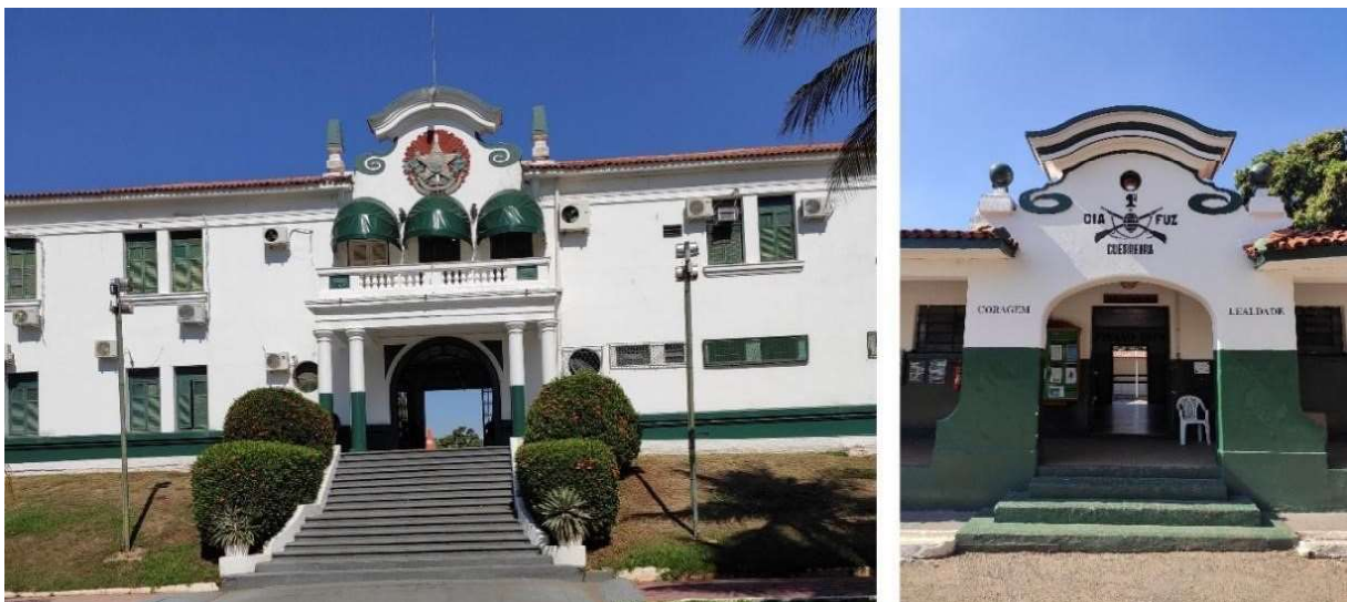
Figura 10. Fachada principal do Batalhão e fachada de um dos pavilhões internos de alojamento.

O Palácio Episcopal (1941) e o 16º Batalhão de Caçadores (1941) apresentam motivos decorativos mais evidentes. O pavilhão principal de entrada do Batalhão possui dois pavimentos e a entrada principal é marcada pela simetria e por um grande frontão curvo com volutas e pináculos nas laterais, além de uma sacada com guarda corpo formado por balaústras e apoiada por quatro pilares com capiteis frisados. Os demais pavilhões que compõem o complexo do batalhão também possuem suas fachadas marcadas pelos mesmo frontões e volutas, além de detalhes que remetem a elementos da cultura militar (fig. 10).