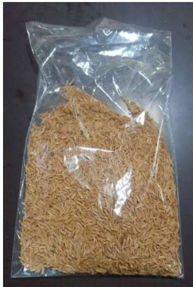
Figura 1. Casca de arroz utilizada na pesquisa.

A matéria-prima alternativa utilizada neste estudo foi a cinza da casca de arroz (CCA). A casca de arroz foi adquirida na empresa Café Itans, localizada no município de Caicó/RN (Figura 1).