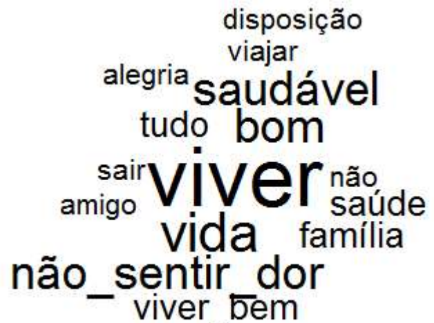
Figura 2. Word Cloud das evocações sobre saúde

Neste caso, a autonomia está ligada, ainda que de forma distante, ao viver e à saúde, possibilitando a mobilidade, liberdade e livre arbítrio, onde sair e viajar fazem todo o sentido para a saúde com conforto e sem temores.